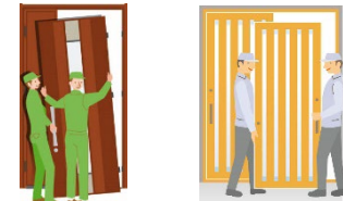
既存ドアを取り除き、新たなドア・引戸に交換