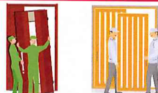
既存ドアを取り除き、新たなドア・引戸に交換